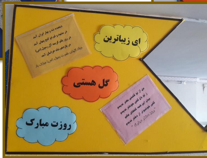
مراسم جشن ولادت حضرت معصومه (س) و روز دختر برگزار شد. ازدانش آموزان با شیرینی و بستنی پذیرایی صورت گرفت.